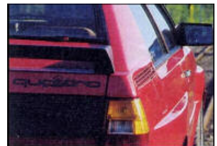
Markante Ansicht: das Design von C-Strebe und Heckflügel ist unverkennbar quattro.