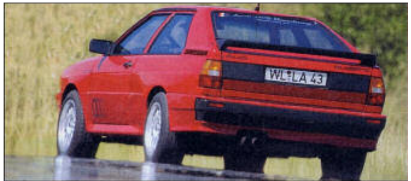
Die markanteste Ansicht des quattro - so jedenfalls bekamen ihn die meisten Autofahrer zu sehen. Doch der Allradantrieb verführte leicht zum schnellen Fahren auf glattem Untergrund - mit häufig bösen Folgen.