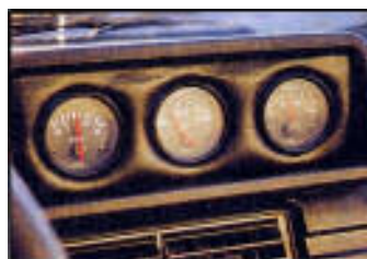
Typisch Audi: Griffiges Sportlenkrad, die klar gekennzeichneten Instrumente liegen genau im Blickfeld des Fahrers.