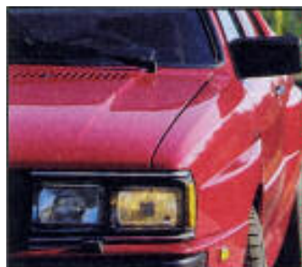
Pausbäckig: Kotflügel sind vorn und hinten leicht ausgestellt, damit auch breite Rallyewalzen noch drunter passen.