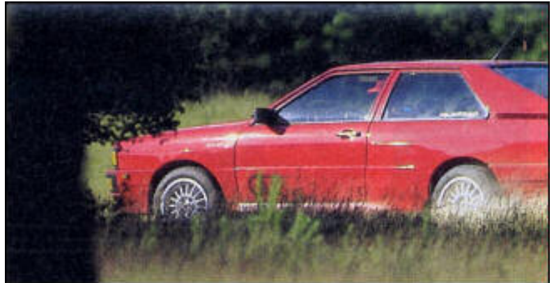
Eindrucksvoll: Wenn alle vier Räder durchdrehen, dann staubt 's gewaltig in der Heide, dann ist sozusagen der Walter Röhrl los.

Gemeint ist ein Auto für Mitdenker, in dem man lenken, bremsen, kuppeln, schalten und Gas geben muss, gleichzeitig aber am Rad drehen, einen linken oder rechten Hebel ziehen kann oder beide gleichzeitig, Um sich in Situationen zu bewähren, in die ich erst gar nicht kommen will. Ich heisse ja nicht Walter Röhrl. Ich bin auch nicht Michele Mouton. Zumal es den gewissen kleine Unterschied gibt, der so definiert wird: der quattro trennt die Männer von den Buben, aber nicht die Männer von den Frauen.